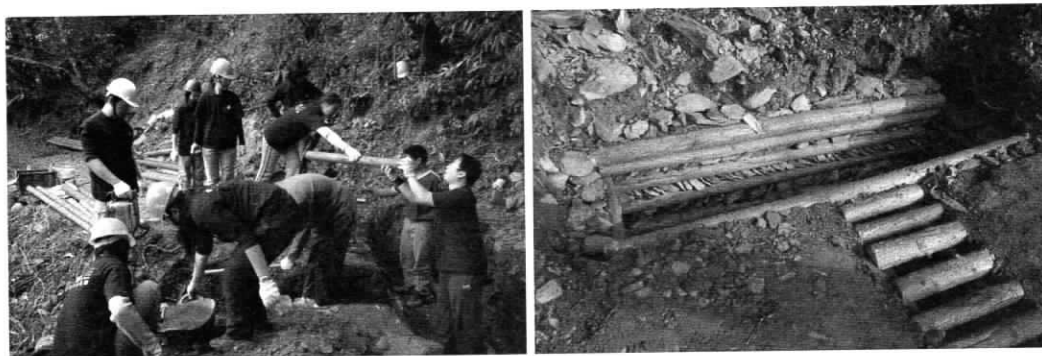
圖 2 本年度 1 月初於霞喀羅古道辦理之生態工作假期，志工施作步道集水設施與導溝情形與完成成果